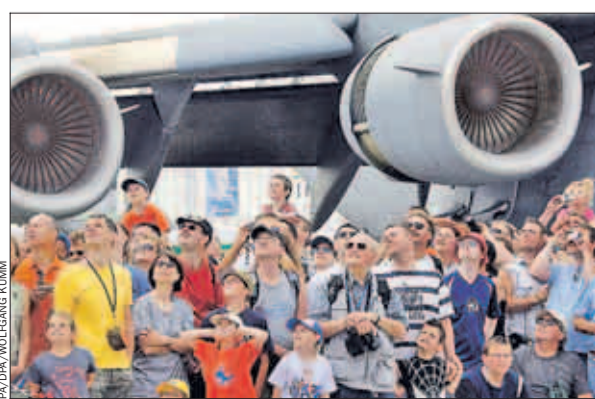
Zuschauer magnet: Dicht gedrängt stehen die zahlreichen Besucher der ILA. Doch die Zukunft der Luftfahrtschau ist gefährdet

Die Länder haben noch zwei Tage Zeit, um die offenen Fragen zu klären. Es ist es kein Geheimnis, dass der BDL mit der ILA gern in Berlin bleiben will. Genauso unstrittig aber ist auch, dass er als Inhaber der Marke äußerst verärgert über die Landesregierungen von Berlin und Brandenburg ist. Man habe es sich lange nicht vorstellen können, dass die Politik mit den nötigen Entscheidungen für die ILA ab 2012 so hinterherhinke, heißt es intern.